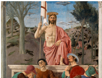
Piero della Francesca, La Resurrezione, Sansepolcro

Quando rileggo i passi dei vangeli in cui si racconta l'arresto, il processo di Gesù e la messa a morte nel modo più ignominioso del tempo - la crocifissione - da parte dei potenti religiosi e politici e poi quando immagino il pianto di chi lo amava mi sento colpita da un sentimento di sgomento. Vedo nel cuore e nei pensieri di coloro che lo avevano seguito un senso di profondo smarrimento, lo sgomento per quello che risulta essere il totale fallimento dell'esperienza nella quale avevano