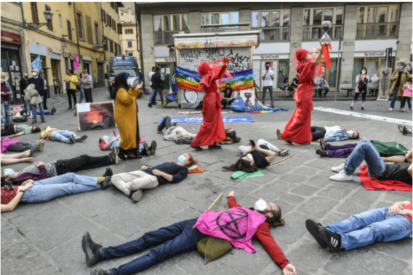
una manifestazione di Extinction Rebellion a Firenze

NON C'È PIÙ TEMPO: CI RIBELLIAMO PER AVERE ANCORA UNA SCELTA.