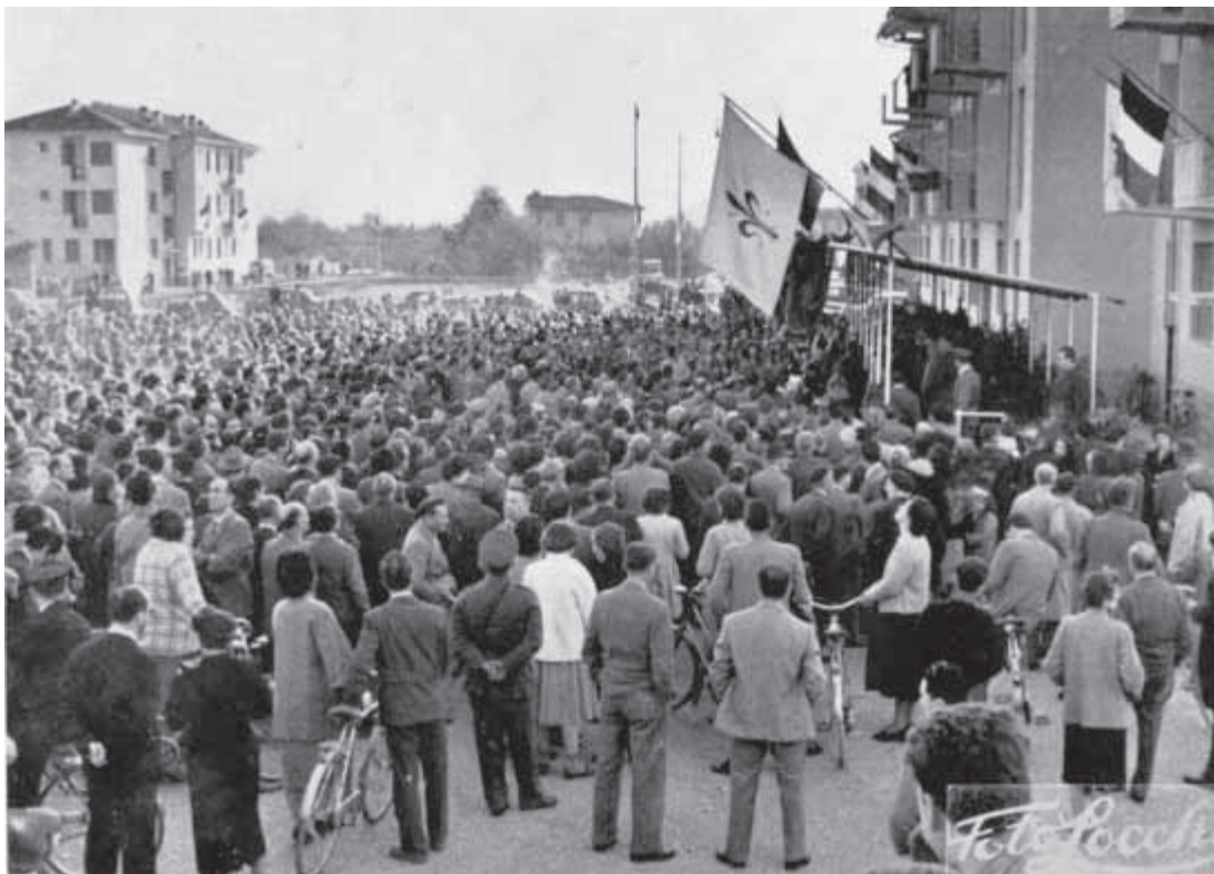
Gli assegnatari alla cerimonia di consegna delle chiavi

Anche per questo motivo è importante, soprattutto oggi, riconsiderare la sua lezione che, sui temi cruciali del potere, della democrazia e del dialogo, manifesta un’attualità sorprendente.